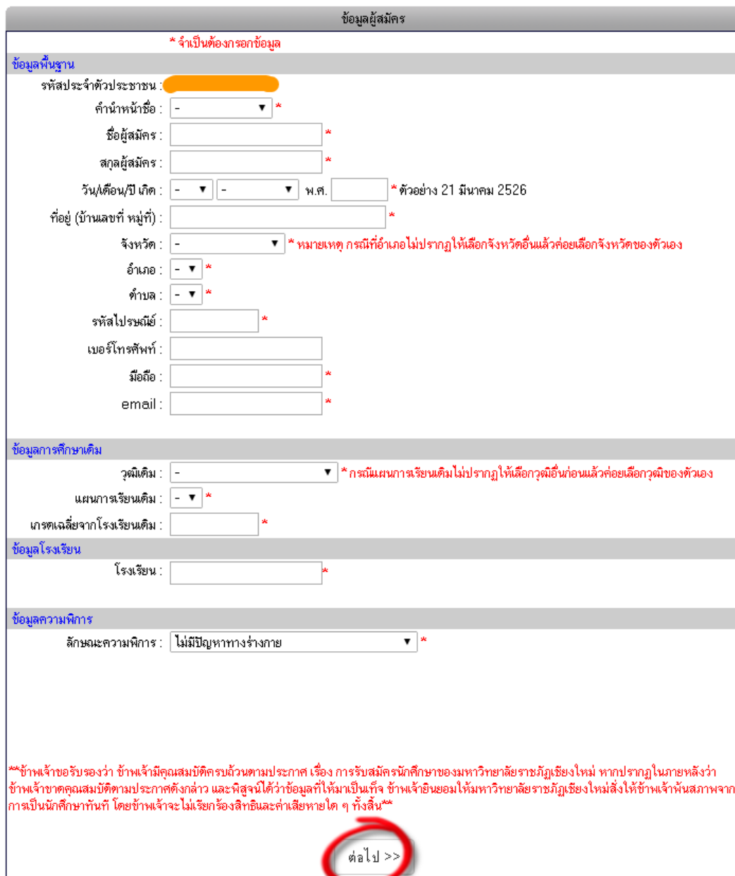
รูปภาพที่ 4